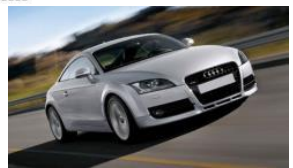
純正部品とPFF85-502Gの比較